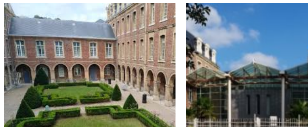
Le lycée François 1 er